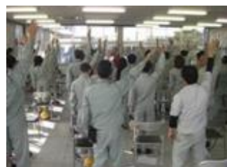
《成人病予防セミナー》